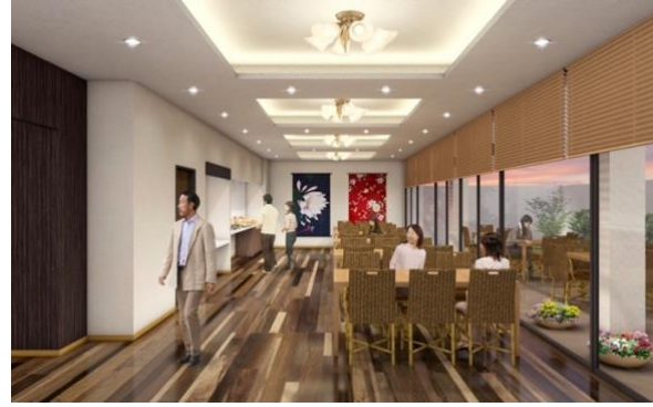
ホテルロビーイメージ