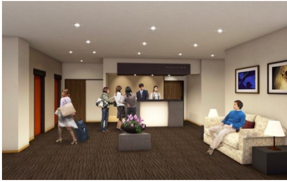
フロントイメージ